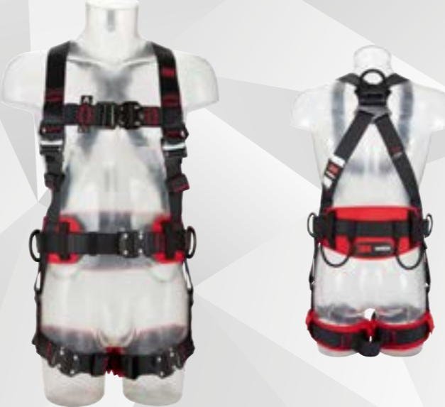
Cinturón confort, cinchas horizontales en perneras